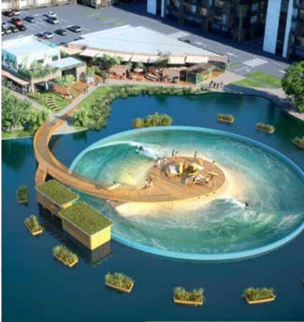
La vague artificielle se fait attendre sur la Technopole du Futuroscope.

Repoussée à plusieurs reprises, la vague de surf artificielle prévue sur le lac de la Technopole pourrait émerger en 2025, alors qu'elle était annoncée cet été. La société Okahina Wave doit encore lever 1,5M€.