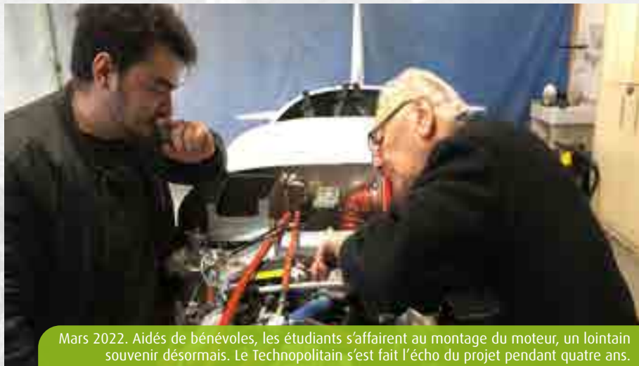
Mars 2022. Aidés de bénévoles, les étudiants s'affairent au montage du moteur, un lointain souvenir désormais. Le Technopolitain s'est fait l'écho du projet pendant quatre ans.

Plus d'infos à build2fly@ensma.fr . Une cagnotte est en ligne pour les aider à réaliser le tour d'Europe des écoles aéronautiques sur le site helloasso.com .