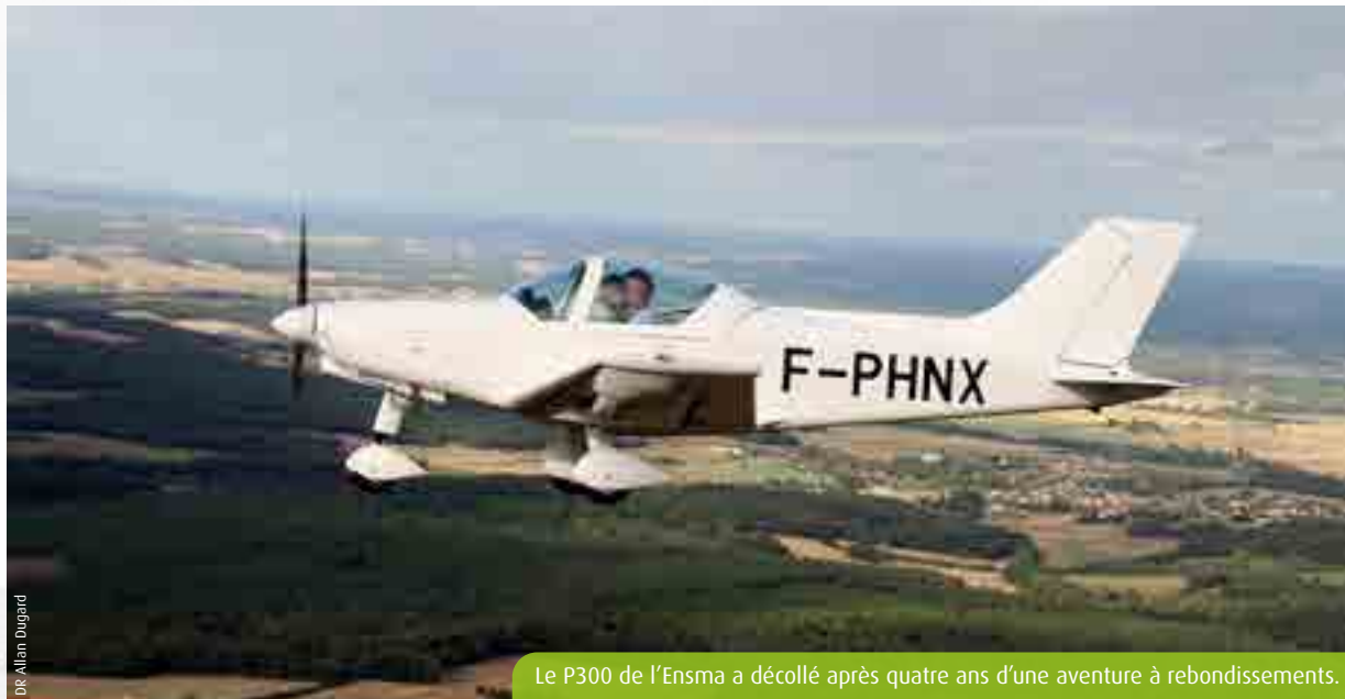
Le P300 de l'Ensm a décollé après quatre ans d'une aventure à rebondissements.

Officiellement inauguré le 14 octobre à l'aérodrome de Châtelleraut, l'avion-école de l'Ensm réalisera un tour d'Europe des écoles aéronautiques au printemps 2024. L'aboutissement d'un projet collaboratif remarquable mais semé d'embûches.