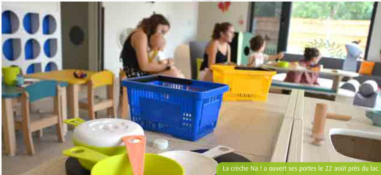
La crèche Na ! a ouvert ses portes le 22 août près du lac.

La poste de Chasseneuil-du-Poitou, située au 4, rue Leclanché, Résidence du Parc, ferme pour travaux jusqu'au 5 octobre. Durant toute la période, des mesures de continuité de services sont mises en place pour les habitants du secteur. Ils peuvent effectuer leurs opérations postales et bancaires habituelles et retirer les colis et courriers avisés à la poste de Jaunay-Marigny, 72B, Grand-Rue à Jaunay-Clan, les lundi, mardi, mercredi et vendredi de 9h à 12h et de 13h30 à 16h30, le jeudi de 9h à 12h et de 15h à 18h, et le samedi de 9h à 12h. Ils ont également accès aux services de la Banque postale en ligne, au 3639 ou sur labanquepostale.fr .