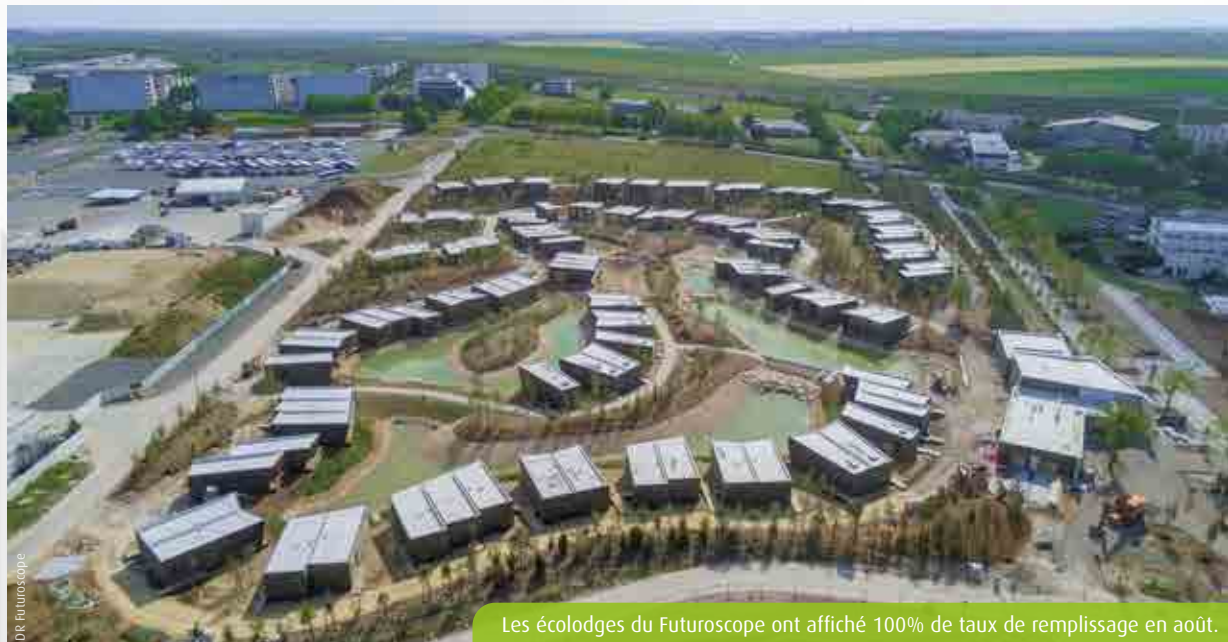
Les écolodges du Futuroscope ont affiché 100% de taux de remplissage en août.

Le Futuroscope devrait clore l'exercice 2023 sur une hausse de 100 000 visites et un chiffre d'affaires en très nette augmentation. Un paradoxe après un été plus timide qu'en 2022.