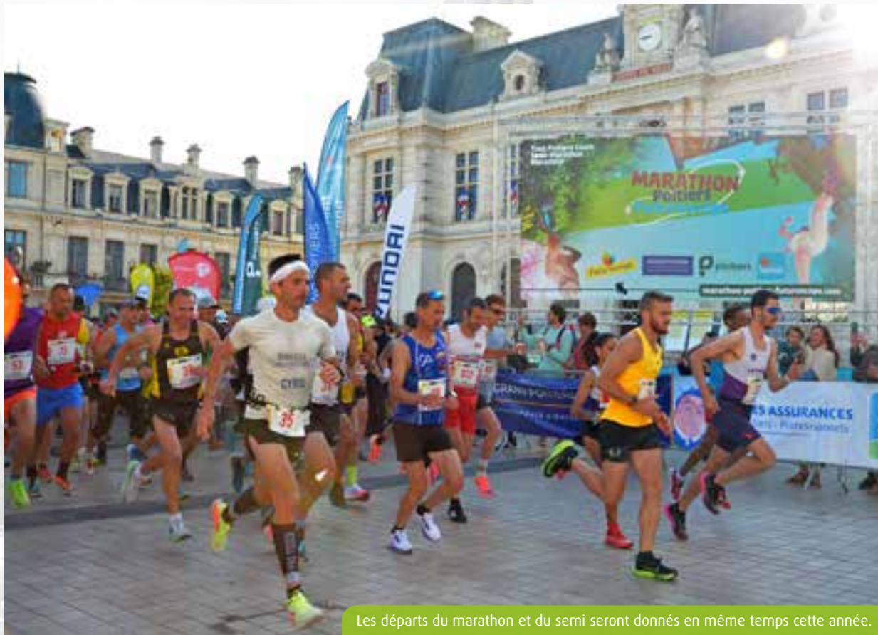
Les départs du marathon et du semi seront donnés en même temps cette année.